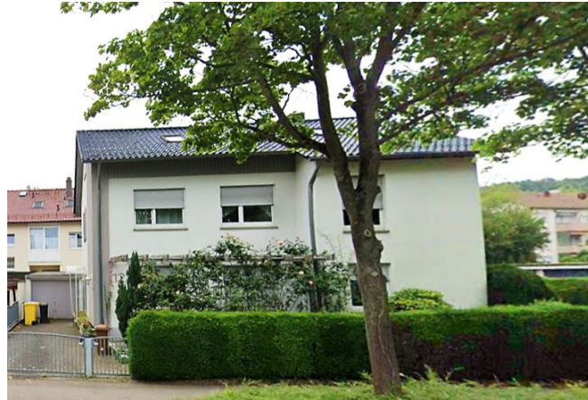
Das neue Wohnangebot in der Esslinger Straße in Fellbach.

Angekommen! Im November 2025 fanden die Einzüge in das neue Wohnangebot in der Esslinger Straße in Fellbach statt. Das Angebot dient als Ersatzwohnangebot für unser Wohnhaus in der Neustädter Straße in Waiblingen, das wir Ende 2025 endgültig aufgeben mussten. Alle Klient*innen fühlen sich seit Beginn an wohl im neuen zu Hause und erkunden derzeit den neuen Sozialraum.