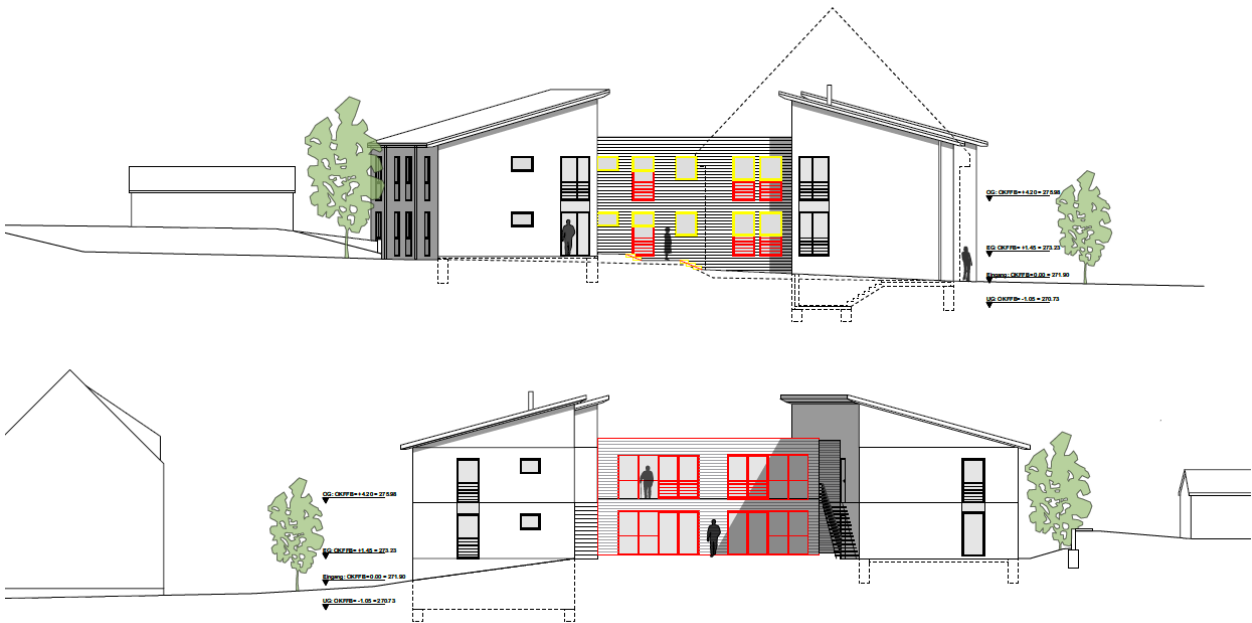
Urbach, Schrödergasse 15, Ansicht Nord/Süd aus Bauantrag

Das derzeitige Gemeindepflegehaus des Alexander-Stifts soll zu einem Wohnhaus für Menschen mit Behinderung umgenutzt werden. Nach Erwerb der Immobilie und entsprechenden, notwendigen Umbau- und Sanierungsmaßnahmen soll ein bedarfsgerechtes, barrierefreies Wohnhaus für 24 Menschen mit Behinderung in 4 Wohnungen für jeweils 6 Klient*innen entstehen. Es dient als Ersatzwohnangebot für derzeitige Bewohner*innen des Schlossberges in Kernen-Stetten – denn die dortigen Wohnhäuser müssen bis 2028 aufgegeben werden.