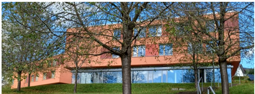
Das „neue“ Wohnhaus am Haldenberg 10+12

Der Zeitplan kann erfreulicherweise gehalten werden!