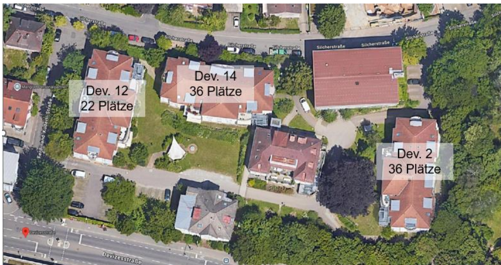
Die derzeitigen Wohnangebote in der Devizesstraße

Für unsere drei Wohnhäuser in der Devizesstraße liegen zeitlich befristete ordnungsrechtliche Bescheide zur Betriebserlaubnis vor, da sie nicht der Landesheimbauverordnung (LHeimBauVO) entsprechen.