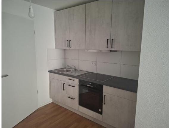
Blick in eine 1-Zi.-Wohnung mit Küchenzeile