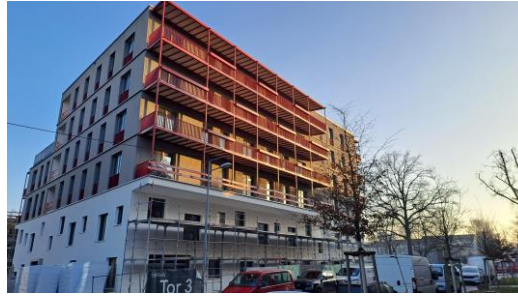
Blick auf die Baustelle