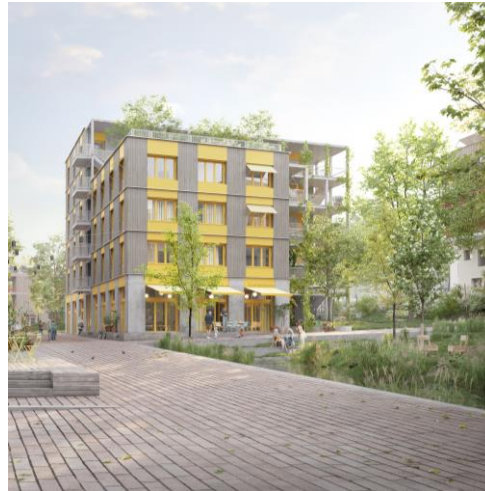
Visualisierung Haus Zidane

Bildnachweis der Visualisierungen: © ISSS research | architecture | urbanism, topo*grafik paysagistes, StudioVlayStreeruwitz, EMT Architekten, Greenbox Landschaftsarchitekten (Visualisierung: Ponnies Images)